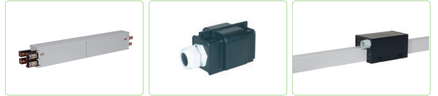
Прямая распределительная секция