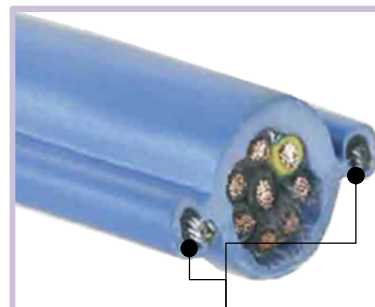
тросы снятия натяжения

Создан для тяжелой работы, в особенности для подвесных пультов управления и подвижных электромеханических устройств. Два троса снятия натяжения избавляют кабель от нагрузки; они диаметрально противоположно впаяны в изоляционную оболочку из ПВХ.